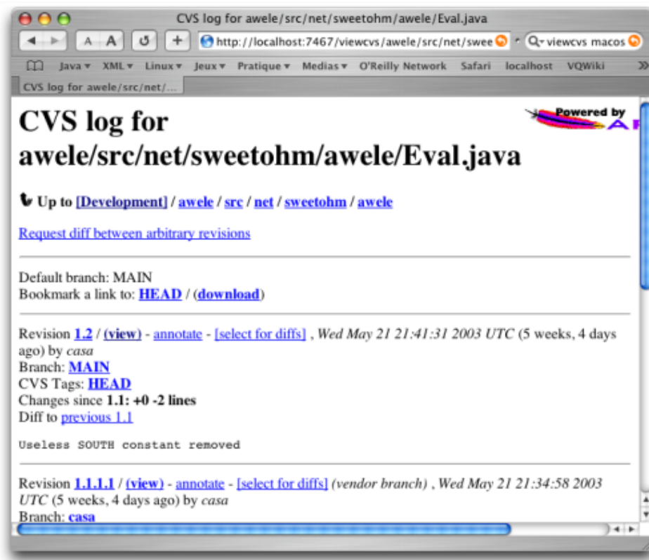
Historique d'un fichier

Il permet en particulier de visualiser l'historique d'un fichier :