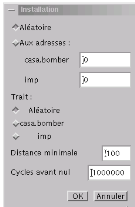
Installer un programme

Cette boîte de dialogue permet de choisir l'adresse où l'on doit installer chaque programme. On peut aussi les installer aléatoirement (c'est l'option à choisir pour des combats ordinaires).